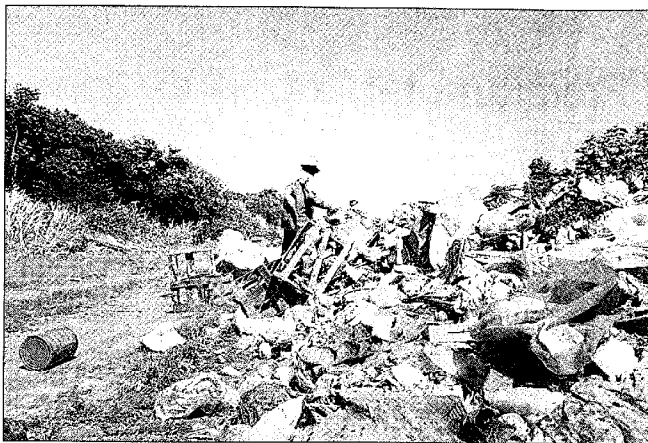
CONSIDERADO FECHADO, um lixão de Búzios ainda recebe detritos

Gericinó, vizinho ao Centro de Tratamento de Resíduos da Comlurb, que recebe duas mil toneladas de lixo por dia, principalmente da Zona Oeste. A prefeitura formalizou pedido de licenciamento, junto ao Inea, para ampliar o aterro existente, mas precisa ter o problema do despejo irregular resolvido.